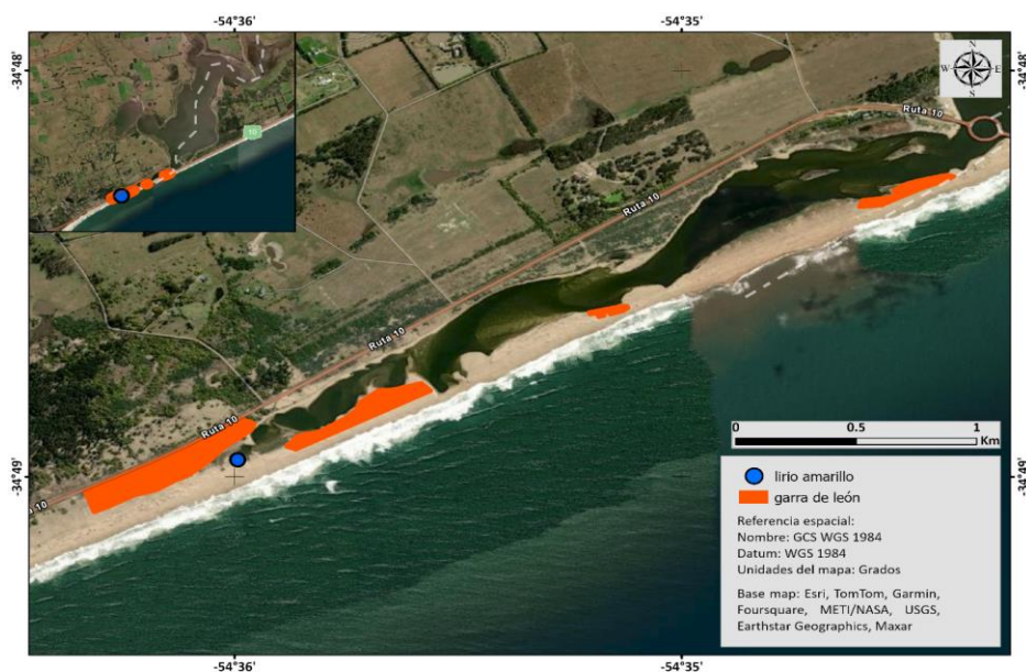
Figura 19.2. Localización de garra de león y lirio amarillo en Laguna Garzón

El área de control de garra de león en Laguna Garzón tiene una superficie estimada de 10 hectáreas. Se aclara que la garra de león no ocupa un continuo, sino que se ubica en parches dentro de las zonas indicadas en la Figura 19.2. Además se deberá intervenir los focos de lirio amarillo indicados.